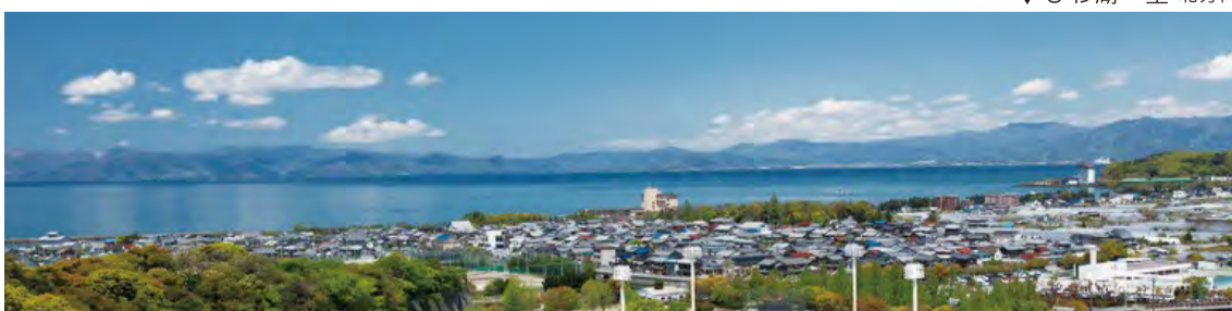
▼びわ湖一望 北方向