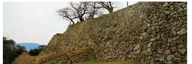
▼井戸曲輪からみる着見櫓と石垣

天秤櫓と西の丸三重櫓の外側に築かれた大堀切(大きな空堀)。この二カ所に架けられた橋が落とされた場合の本丸への侵入経路は、普通に考えると二つ。高い石垣を登るか井戸曲輪を攻略するかだ。しかしこの曲輪の門は狭く、武装した兵士は少人数ずつしか通ることができない。門をくぐろうとすれば迎え撃たれ、運良く通っても石垣の上や櫓からは矢や鉄砲の集中砲火……。攻略するのは至難の業だろう。