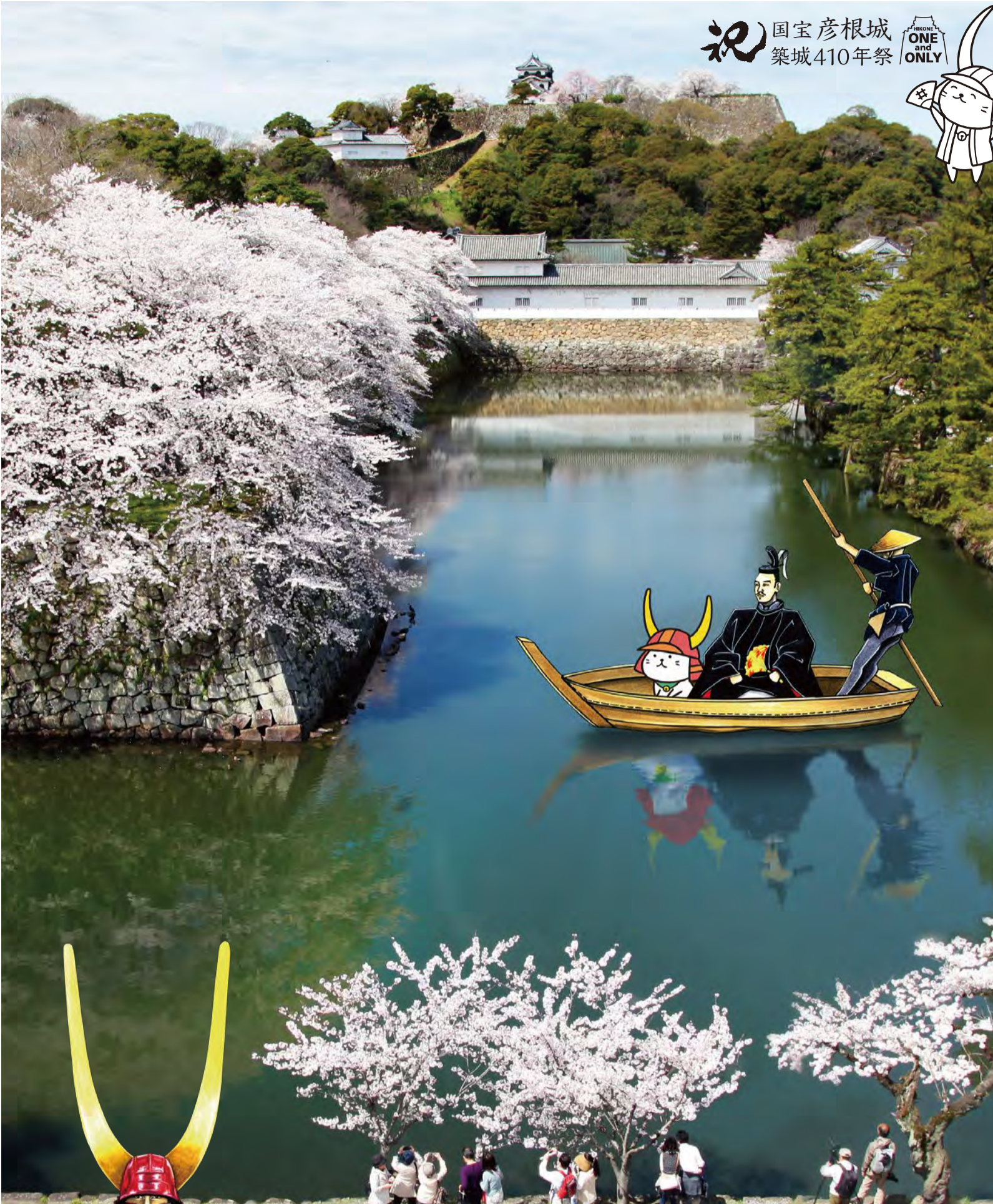
Photo:彦根キャッスル リゾート&スパ 城見のテラスより彦根城と中堀を望む Illustr:屋形船で花見を愉しむ ひこにゅんと直政公 ひこにゅん 彦根市許諾(無償)No.H1620076

彦根キャッスル リゾート&スパ HIKONE CASTLE RESORT & SPA