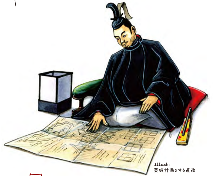
Illustr: 築城計画をする直政