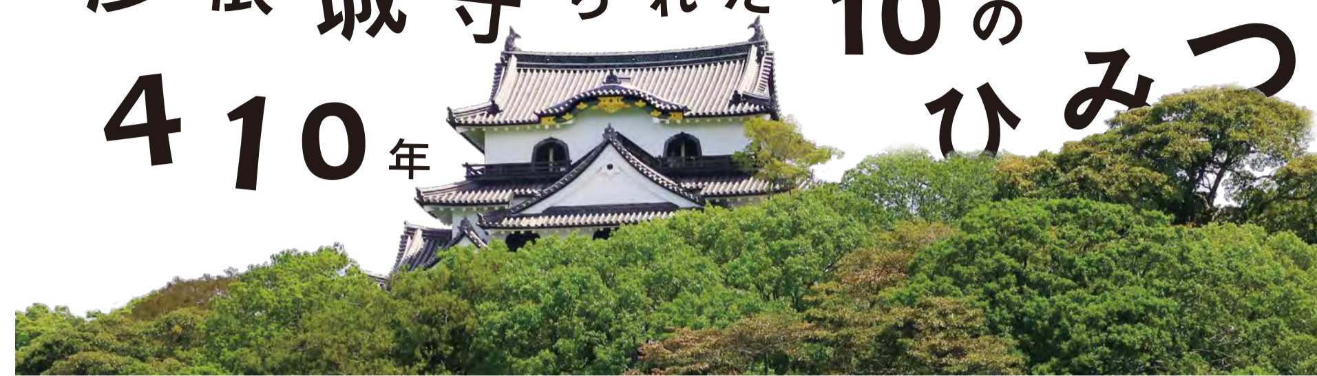
彦根城が410年守られたひみつ

彦根城には、戦に備えた工夫や管理・維持するためのアイデアがいっぱい！ ここにもそこにもあそこにも……。訪れる前に知っておけば、彦根城散策がもっと面白くなるはず。